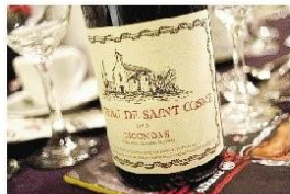
Château de Saint-Cosme 酒莊的紅酒