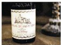
▲以葡萄園地名命名的Gigondas紅酒，質量非同一般，存放20年飲用酒質更佳。 ▲當釀成新臥地山風雲秀麗，猶如壯觀壯麗，Saint Cosme酒莊就在Gigondas村入口左側。